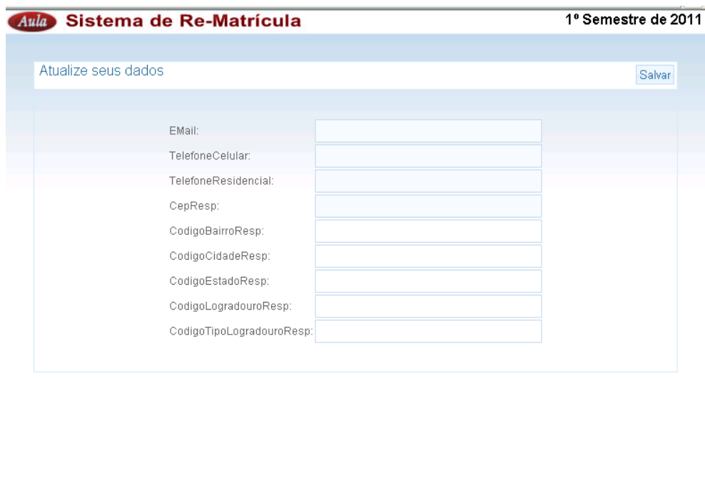
Tela para atualização dos dados

Para o curso de graduação é apresentada a tela para a escolha das disciplinas ofertadas no semestre.