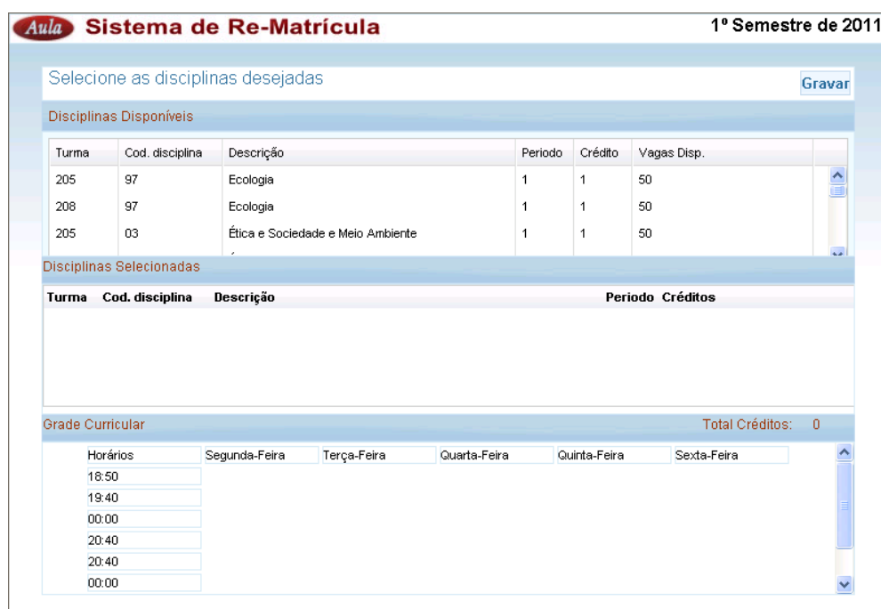
Tela para escolha das disciplinas

O aluno poderá escolher as disciplinas que quiser dentro das apresentadas. É importante verificar que se forem escolhidas disciplinas em turmas diferentes, que sejam lecionadas no mesmo dia e horário o sistema não realizara a matricula. O aluno só poderá se matricular em uma das duas.